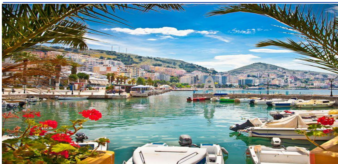
Particolare città di Valona

Prima colazione in hotel. Partenza per Durres , la seconda città più grande del Albania e uno dei più antichi, fondato nel VII a. C. Per secoli è stato il più grande porto adriatico. La nostra visita include l' Anfiteatro, la Torre veneziana e i Muri del periodo bizantino . Light lunch libero. Continuiamo il tour verso Berat , conosciuta come " la città dalle mille finestre ", dichiarata Patrimonio Mondiale dell'Umanità dall'UNESCO. Conosceremo Mangalem, Gorica e Kalaja . Berat è una testimonianza vivente della coesistenza di vari eventi religiosi e culturali. Visiteremo il Castello con il Museo Onufri al interno, con le sue icone del XVI secolo. Arrivo in hotel a Berat e sistemazione nella camere riservate. Cena e pernottamento