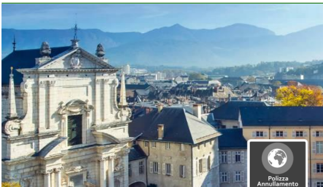
Panorama di Chambery