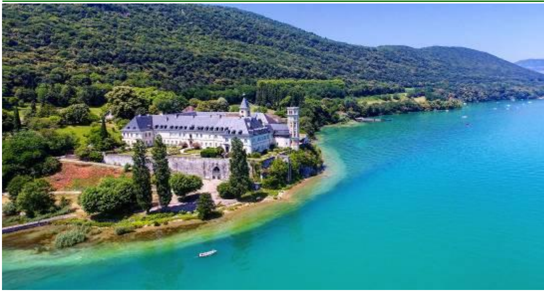
Panorama del Lago di Bourget

Prima colazione in hotel e partenza per la Francia . Attraverso il traforo del Frejus entreremo in territorio francese, tra splendidi paesaggi montani e boschivi, per raggiungere Chambery . La "città dei duchi", chiamata così per essere stata scelta da casa Savoia come capitale del loro ducato. Potremo visitare il Castello , che risale al XII secolo, e che racconta la storia della dinastia. Tempo a disposizione per un light lunch libero e curiosare nei negozi di artigianato e souvenir. Una passeggiata nel centro storico ci permetterà di scoprire altri interessanti monumenti come la Cattedrale e la famosa Fontana degli elefanti e un dedalo di vicioletti, piazzette e cortili d'ispirazione piemontese. Arrivo in hotel, sistemazione nelle camere riservate, cena e pernottamento.