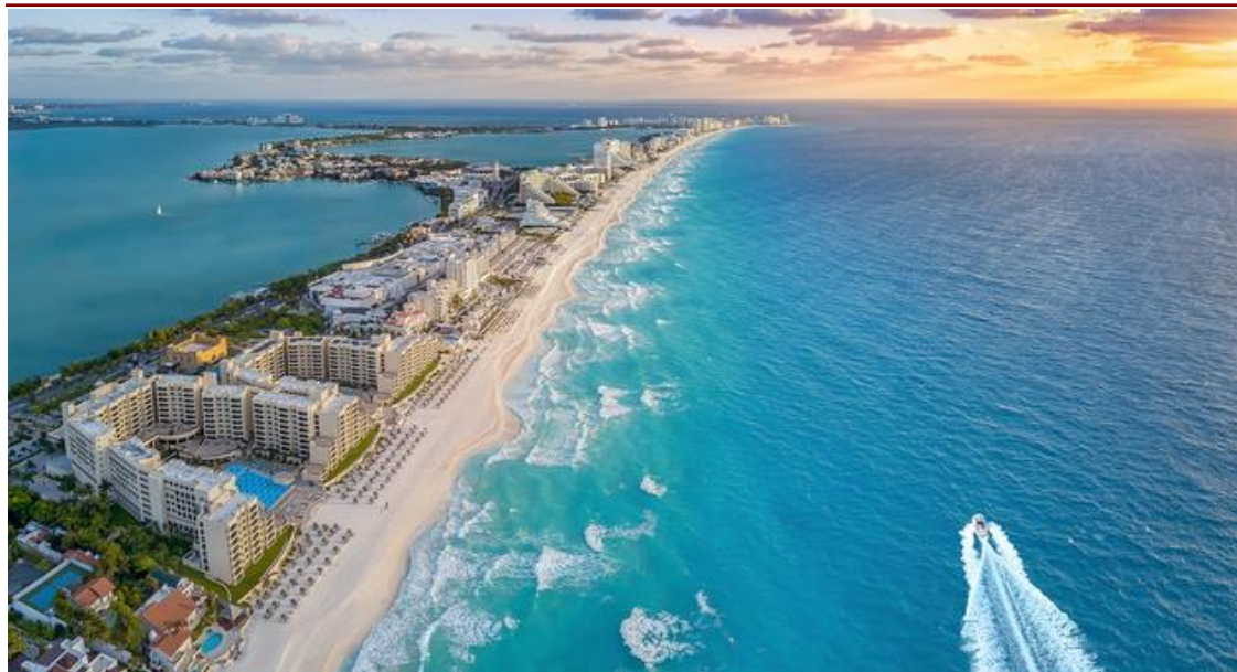
Panorama Riviera Maya Cancun

Prima colazione in hotel. In mattinata partenza per la Riviera Maya , con sosta alla laguna di Bacalar e pranzo in corso d'escursione. Nel pomeriggio arrivo a Cancun e sistemazione in hotel, cena e pernottamento.