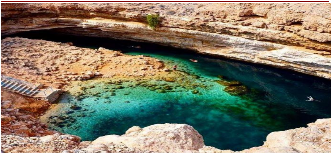
Particolare Bimah Sink Hole

Prima colazione in hotel. Si inizia con la visita della Grand Mosque , la più grande moschea del Sultanato. Questo luogo di culto presenta il secondo tappeto realizzato a mano più grande del mondo, come il secondo lampadario più grande (Abbigliamento: sia gli uomini che le donne devono coprirsi braccia e gambe. Le donne devono coprirsi con un foulard anche la testa). Si prosegue per il Mercato del Pesce di Muttrah per vedere la gente locale nell'attività della compravendita del pescato del giorno. In seguito si giunge alla Corniche , con il porto da un lato e il Souq di Muttrah dall'altro. Pranzo libero. Tempo a disposizione per aggirarsi tra i negozi del souq e per rinfrescarsi con una bibita fresca in un piccolo caffè all'ingresso del mercato. Proseguimento con la visita del Museo di Bait al Zubair , nella parte vecchia della città. Sosta fotografica al Palazzo Governativo di Al Alam , con i forti di Mirani e Jalali sullo sfondo. Cena in ristorante locale. Rientro in hotel e pernottamento.