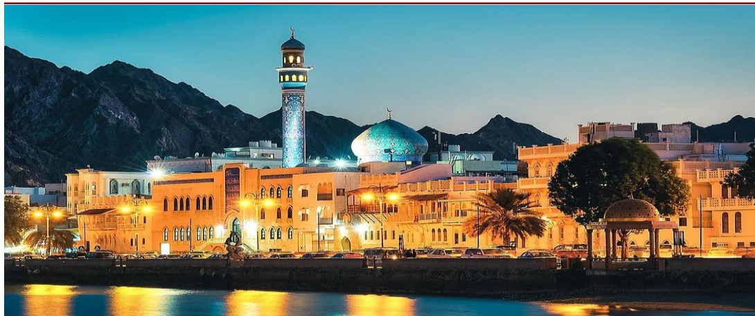
Particolare Grand Mosque