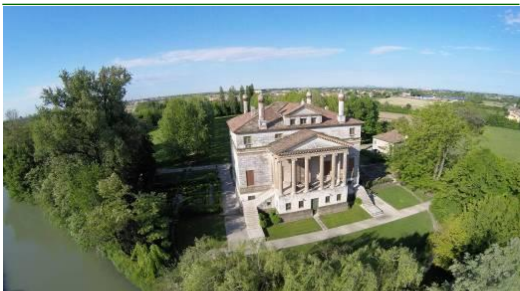
Panorama Villa Pisani a Stra

Prima colazione in hotel. Partenza e sosta lungo la percorrenza per un light lunch libero. Arrivo previsto a Roma in prima serata