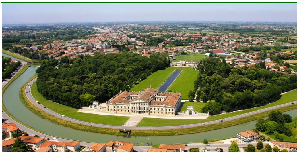
Panorama Villa Pisani a Stra

Appuntamento con i Sigg.ri partecipanti in luogo ed ora da convenire, sistemazione in autopullman G.T. e partenza. Sosta lungo la percorrenza per il light lunch libero. Nel pomeriggio arrivo ad Abano terme e visita dell'incantevole cittadina con la sua Piazza del Sole e della Pace, la Fontana di Arlecchino e i vicoletti caratteristici nei quali immergersi. Arrivo in hotel, sistemazione nelle camere riservate, cena e pernottamento.