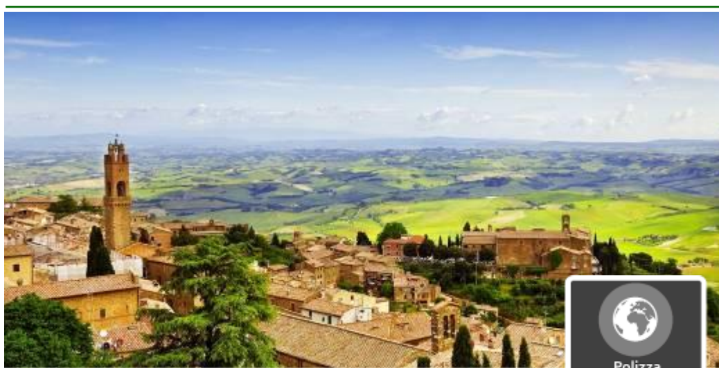
Particolare di Montepulciano